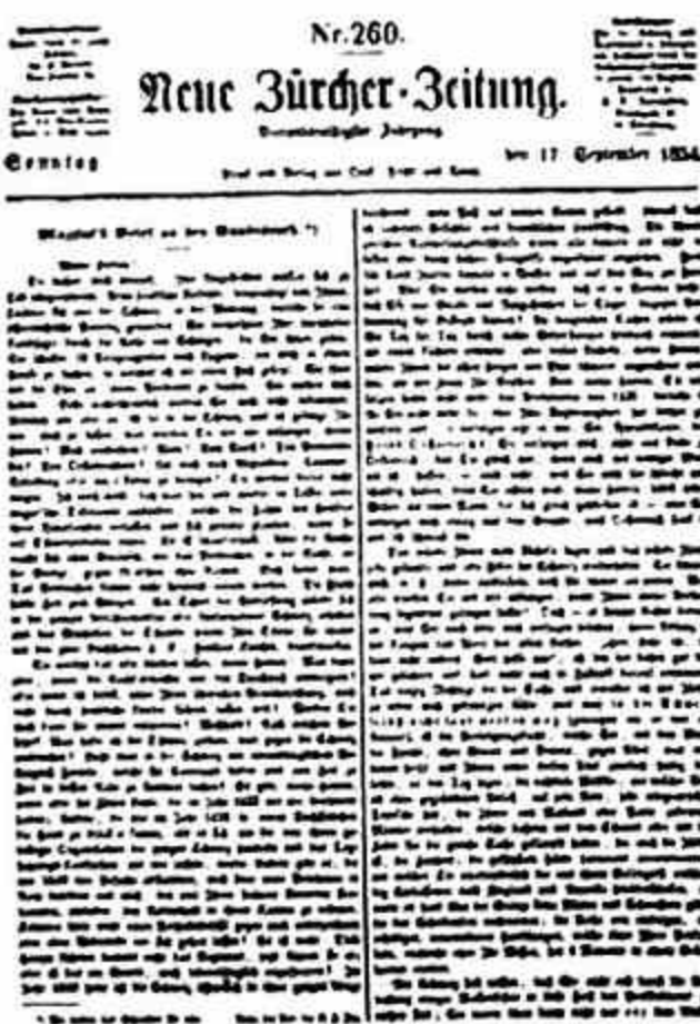
Prima pagina della lettera di Mazzini al Consiglio Federale Svizzero