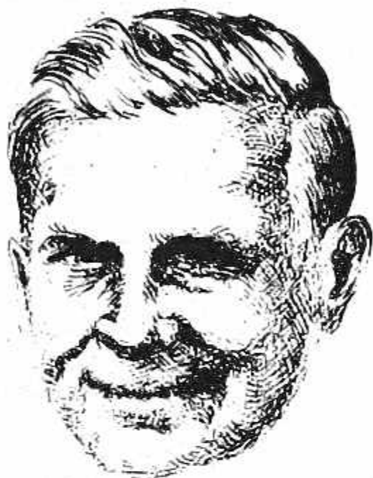
Mario Razzini - disegno di Antonio Fussi.