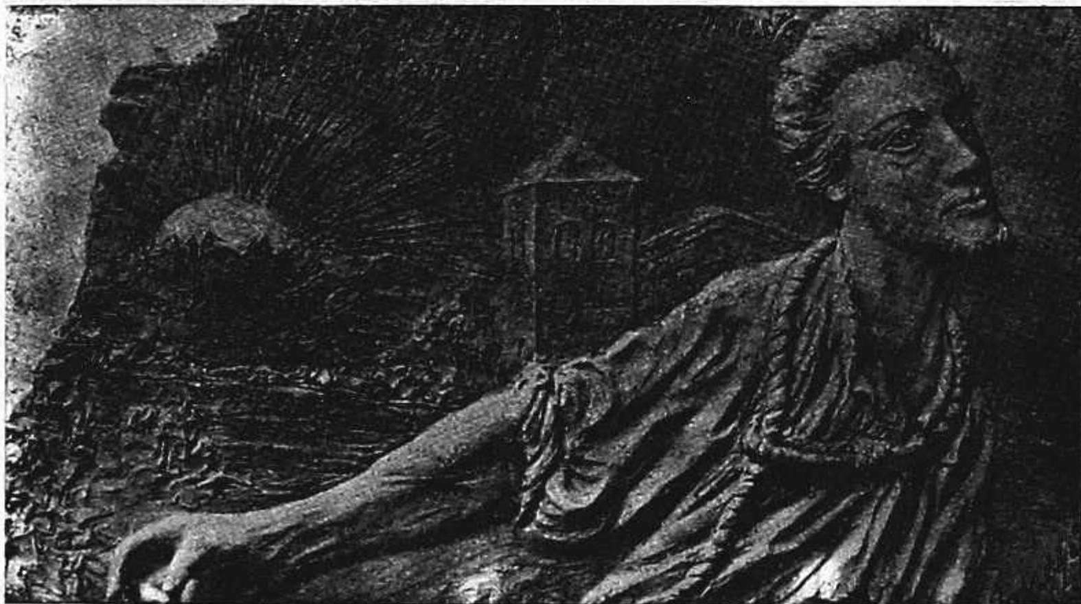
GUGLIELMO OBERDAN - Cartolina edita dall'A.M.I. nel 1945